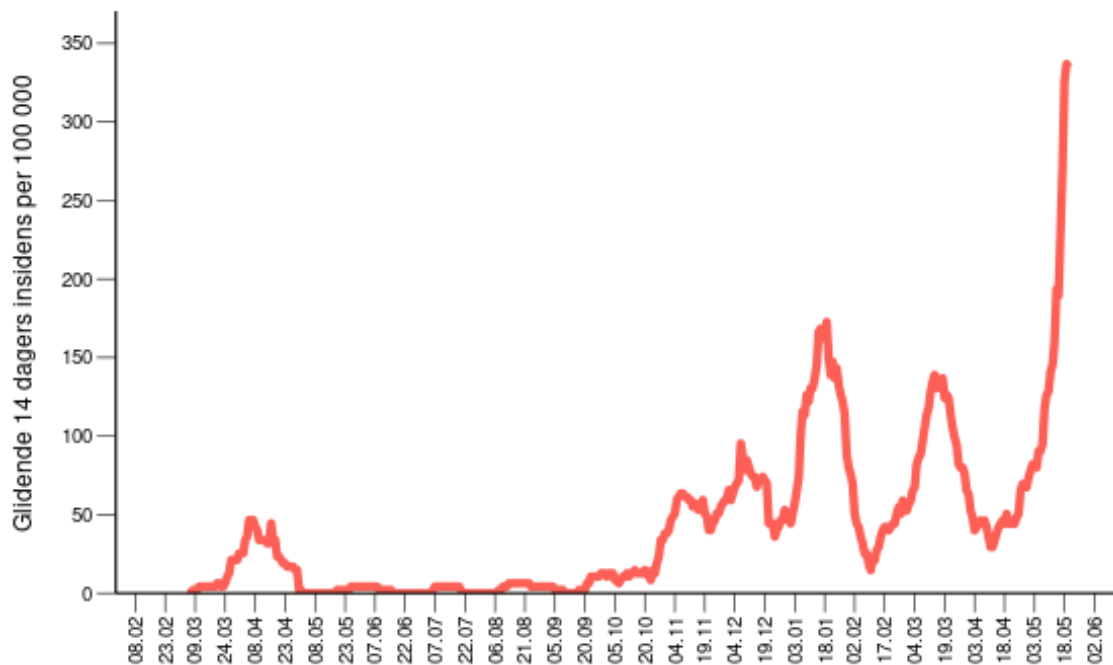
Figur 2. Glidende 14-dagers insidens per 100 000 innbyggere per dag basert på prøvedato gjennom hele pandemiperioden, Larvik.