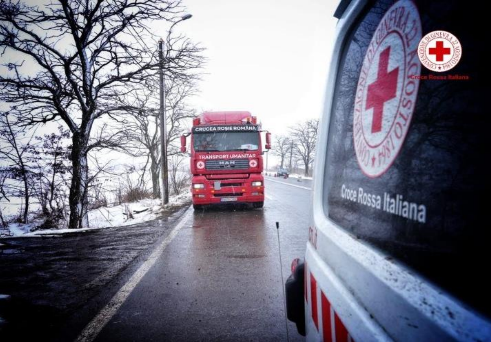
Nødhjelpkonvoi Ukraina 2022