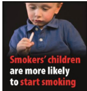
Barn av røykere begynner oftere å røyke