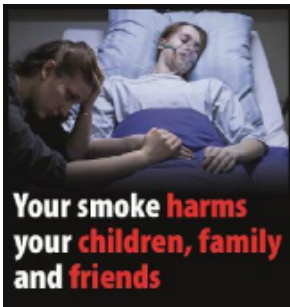
Røyken din skader dine nærmeste