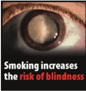
Røyking øker risikoen for å bli blind