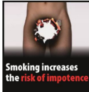
Røyking øker risikoen for impotens