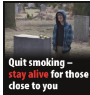
Slutt i dag – lev lenge for dine nærmeste