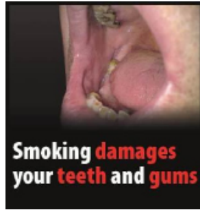
Røyking skader tenner og tannkjøtt