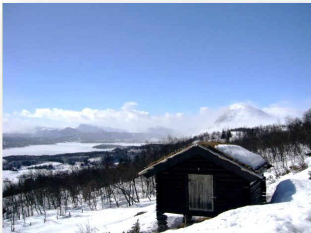
© Solveig Marie Herbern, HelseDirektoratet (illustrasjonsbilde)